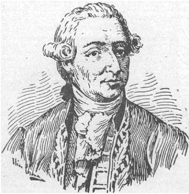
D. Francisco Xavier Balmis y Berenguer, Director de la Expedición Filantrópica de la Vacuna