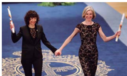
Jennifer Doudna y Emmanuelle Charpentier durante la entrega del Premio Princesa de Asturias en 2015.