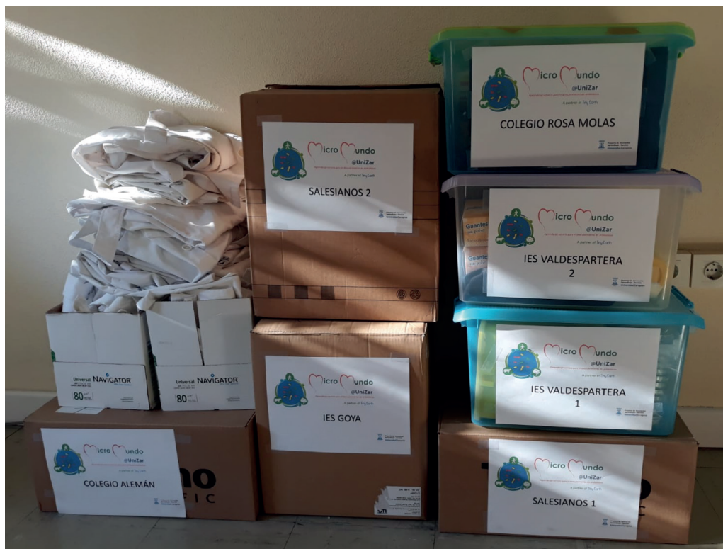
Cajas con el material para cada centro educativo.