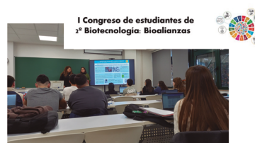
Congreso (presentaciones flash-talk)