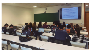
Trabajo en seminarios (entregas semanales)