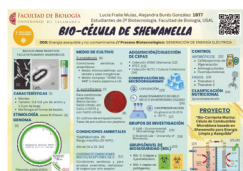
Elaboración de un póster