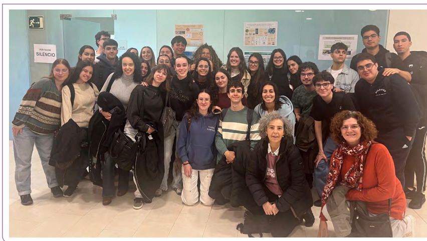
Alumnos participantes en el proyecto (Grado en Biotecnología) junto las profesoras en la exposición de la actividad en la Facultad de Biología (USAL).

Se han cumplido los cuatro objetivos específicos planteados: i) identificación